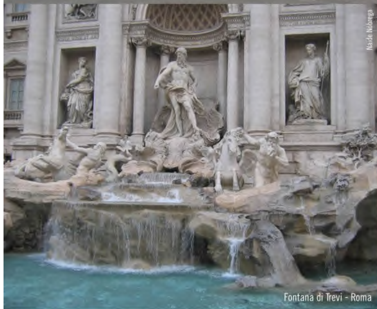
Fontana di Trevi - Roma