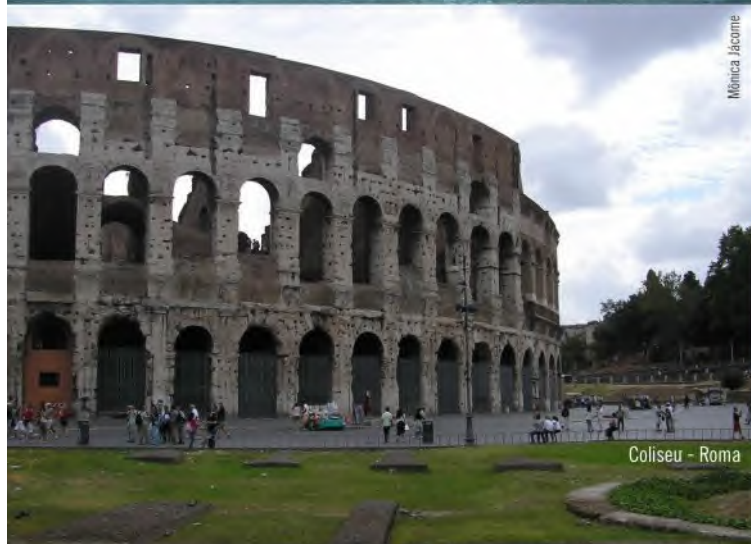
Coliseu - Roma