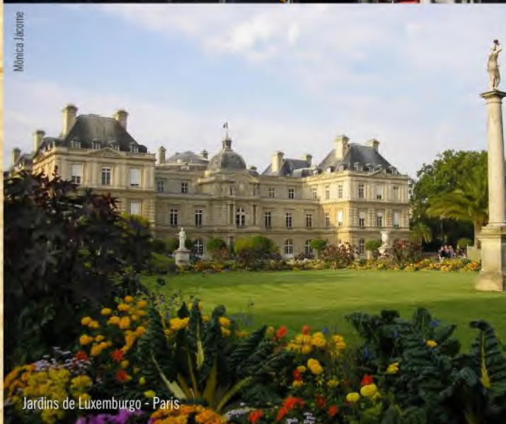
Jardins de Luxemburgo - Paris