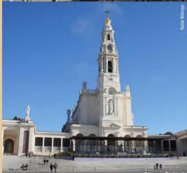
Fátima - Portugal