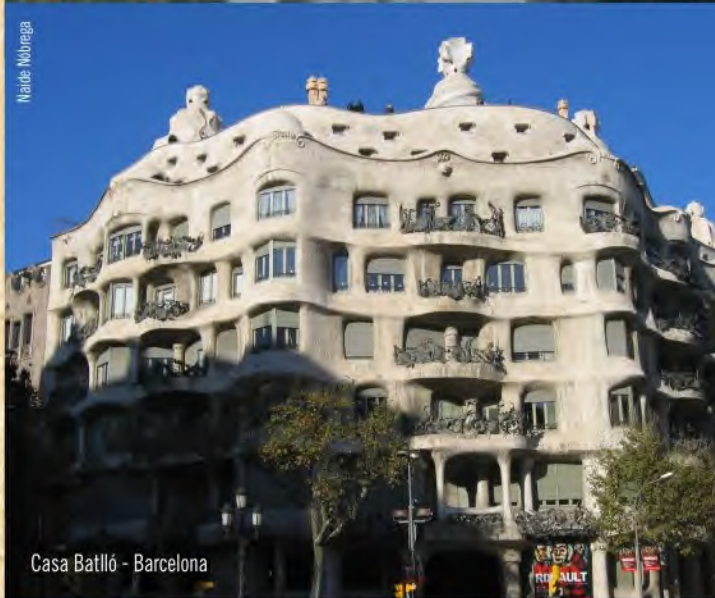
Casa Batlló - Barcelona