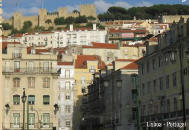
Lisboa - Portugal