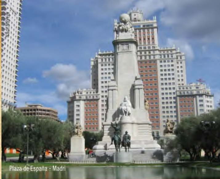
Plaza de España - Madri

Ah, a França... Seus encantos, suas regiões vinícolas, seus castelos... É de fato um país de mil possibilidades, mas neste roteiro vamos falar daquela que é conhecida como a mais linda de todas as cidades francesas: Paris, capital dos casais apaixonados, berço do gótico, tão presente em suas catedrais inebriantes. Passeie por toda a cidade, com direito à Catedral de Notre Dame, ao Museu Du Louvre, Champs Elissé (a avenida mais charmosa do mundo), Arco do Triunfo e a Sacre Coeur, incrustada no bairro de Montmartre. Por falar nos bairros, curta a energia criativa e leve do Marais, passeie pelo Quartier Latin, descubra Montparnasse, passeie de barco pelo Rio Sena, suba a Torre Eiffel e contemple Paris, uma cidade que quanto mais se visita, mais se descobre. Uma creperia aqui, um café logo ali. Entre em todos os bistrôs e não economize seus euros. As lembranças pagarão um a um. A cidade consegue equilibrar o antigo e o moderno, num estilo de vida onde o que vale mesmo é ser feliz.