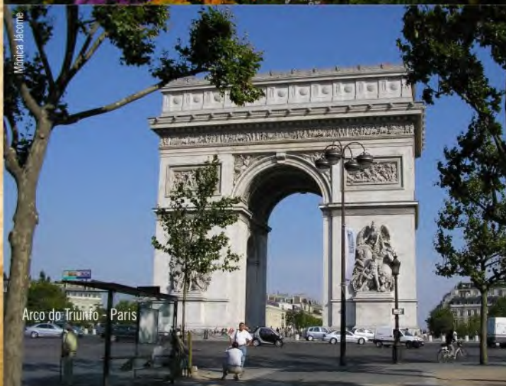
Arco do Triunfo - Paris